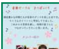
音楽サークル まつぼっくり