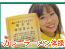
カレーラーメン体操